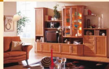
Einrichtungsbispiel 3-S in Erle B/H/T 330/203/36-52 cm