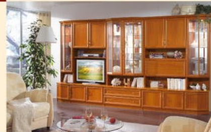
Einrichtungsbispiel 6-S in Kirsche B/H/T 379/203/36-52 cm