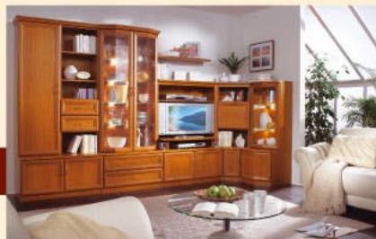
Einrichtungsbispiel 4.4E-U in Kirsche B/H/T 340 x 117/203/36-52 cm