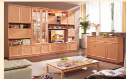
EB 2.1H-S in Apfel B/H/T 342/203/36-52 cm