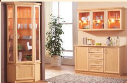
Soloeckzitrine EB 70 in Buche B/H/T 66 x 66/203/43 cm