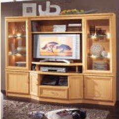
Highboard 41 in Buche B/H/T 192/140/36-48 cm