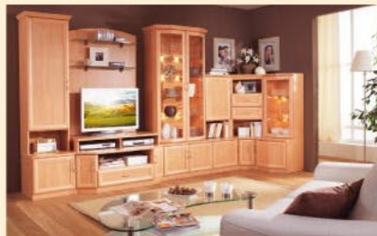
Einrichtungsbispiel 4.3E-U in Apfel B/H/T 363 x 117/203/36-64 cm