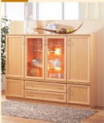
Highboard 40 in Apfel B/H/T 192/140/36 cm