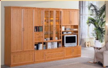
Einrichtungsbispiel 13-S in Erle B/H/T 332/203/36-52 cm