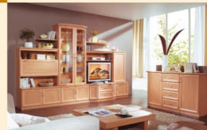
EB 3.4-U in Apfel B/H/T 313/203/36-64 cm