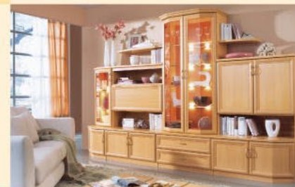
Einrichtungsbispiel 3.3-U in Buche B/H/T 313/203/36-52 cm