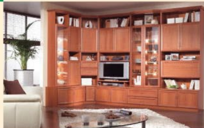
Einrichtungsbispiel 1.3E-U in Kirsche B/H/T 164 x 339/232/36-52 cm